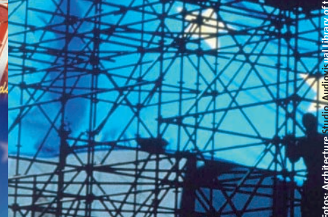
Fotos: Architecture Studio / Audio (Legal Library of the European Commission), CESI